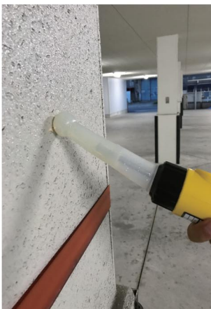
先端が接触すると・・・